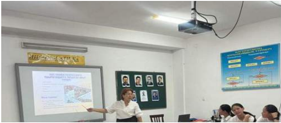
31-мамыр Саяси қуғын-сүргін және ашаршылық құрбандарын еске алу күні